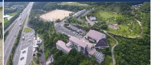
兵庫南あわじスクール