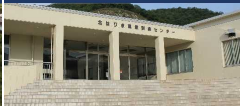
兵庫 北はりまスクール