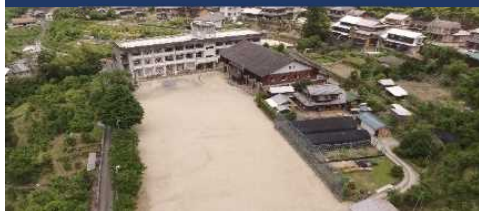
徳島那賀町スクール