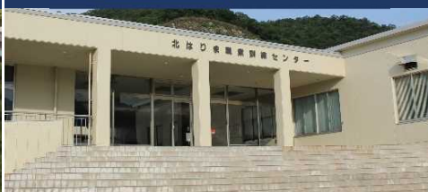
兵庫 北はりまスクール