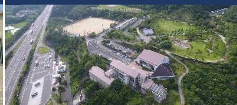
兵庫南あわじスクール