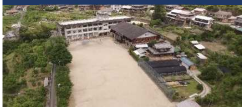
徳島那賀町スクール