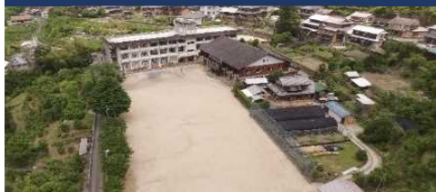
徳島那賀町スクール