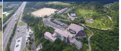
兵庫南あわじスクール