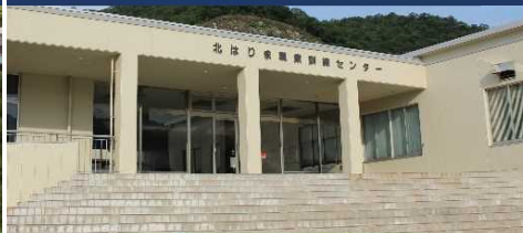
兵庫 北はりまスクール