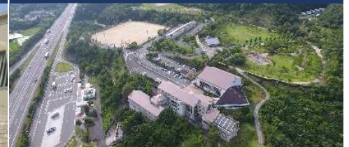
兵庫南あわじスクール