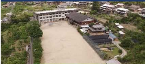
徳島那賀町スクール